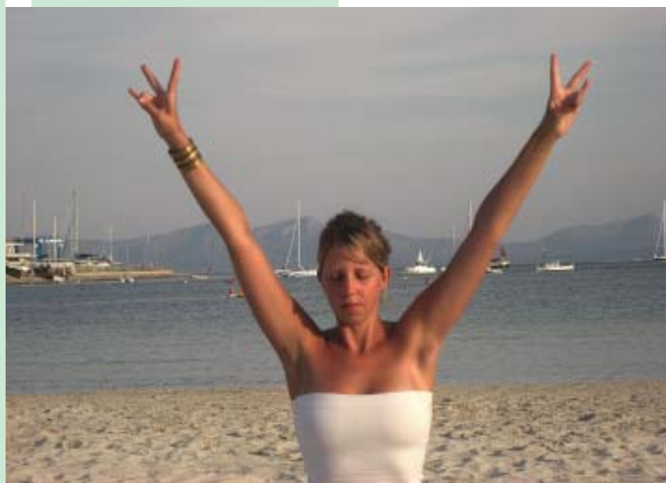
Mit geschlossenen Augen kann man noch besser in sich hineinspüren und die Sonnenstrahlen in der Herzgegend visualisieren