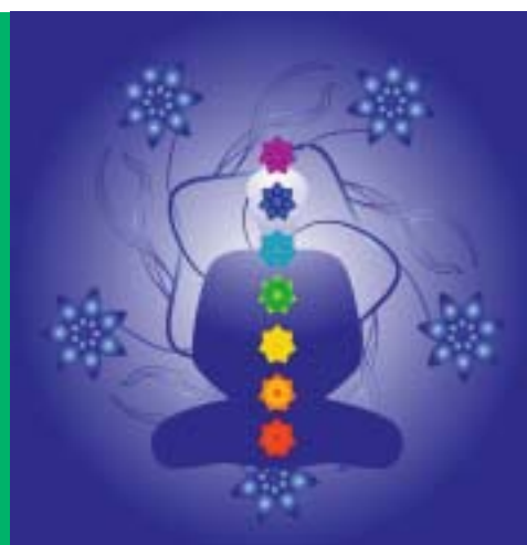
Die Darstellung zeigt die sieben Chakren – auch Energiewirbel genannt – vom Basischakra bis zum Scheitelchakra

Alle Meditationslaute sind übrigens gut auf der am Schluss genannten CD zu hören.