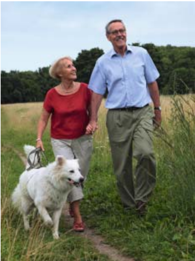
Wenn wir lernen das wertzuschätzen, was das Leben uns an kleinen Freuden bietet, begeben wir uns in eine Welt der Fülle