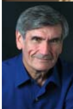
Der Psychologe Marshall B. Rosenberg ist der Begründer der Gewaltfreien Kommunikation (GFK)