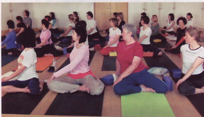
Eine gute Haltung ist nur eine der vielen positiven Effekte der Yoga-Übungen

einer Blütezeit im 15. und 16. Jahrhundert geriet Yoga im eigenen Land fast ganz in Vergessenheit. Erst